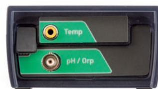
Pannello connettori pH Vio