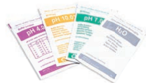
Soluzioni tampone in bustine