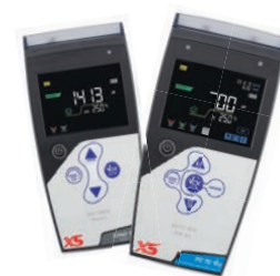
Conduttimetri e Multiparametri